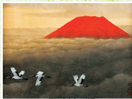
大山 忠作 「赤富士朝陽」 8号