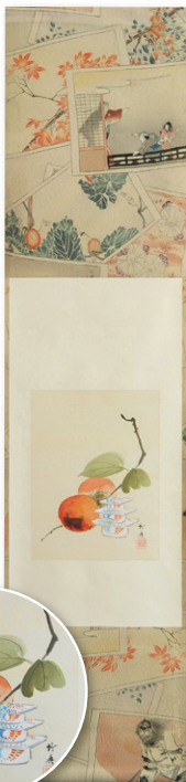
庄司 竹真 「江戸の秋図」 総丈125.5×30cm