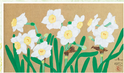
中島 千波 「水仙」 6号