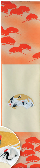
後藤 順一 「瑞鳥図」 総丈117.3×28cm