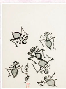
熊谷 守一 「蟻」 40.5×31.5cm