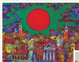
絹谷 幸二 「蒼天旭日ヴェネツィア」 6号