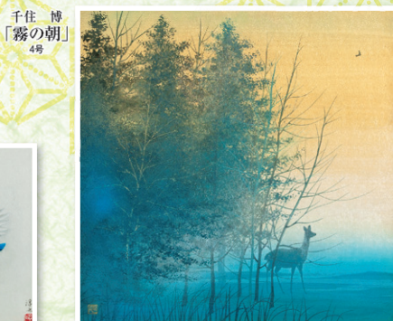
千住 博 「霧の朝」 4号