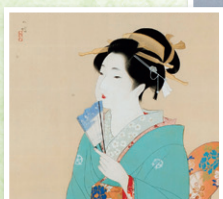
伊藤 小坡 「麗春」 軸装 50.8×45.5cm 絹本・共箱