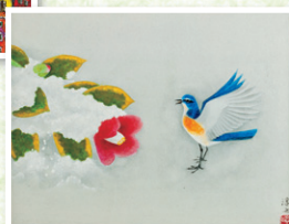
上村 淳之 「雪野」 6号