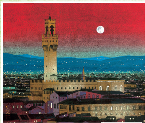
柳沢 正人 「宮殿の月」 10号