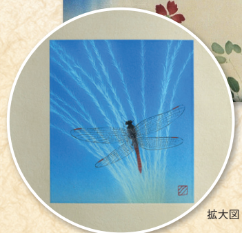
須藤 和之 「秋麗図」 総丈119.8×28cm