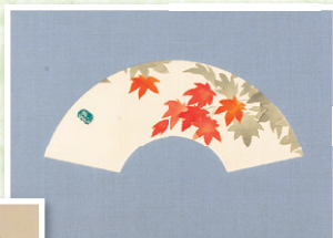
片岡 鶴太郎 「もみじ」 軸装 扇面 46.8cm 絹本・共箱