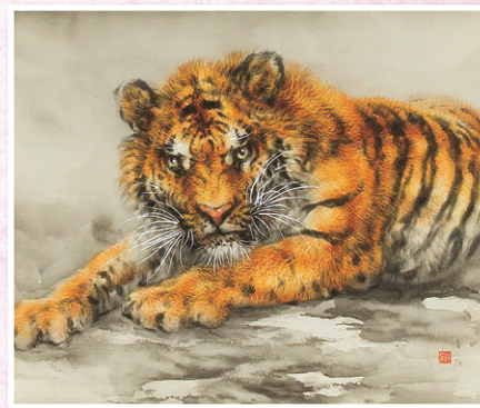
大橋 翠石 「猛虎之図」 44.3×51.5cm 絹本・共箱・東美鑑